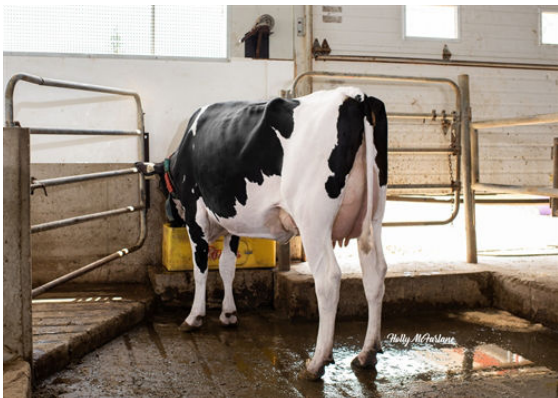
PROGENESIS TOPNOTCH GARNET DAM